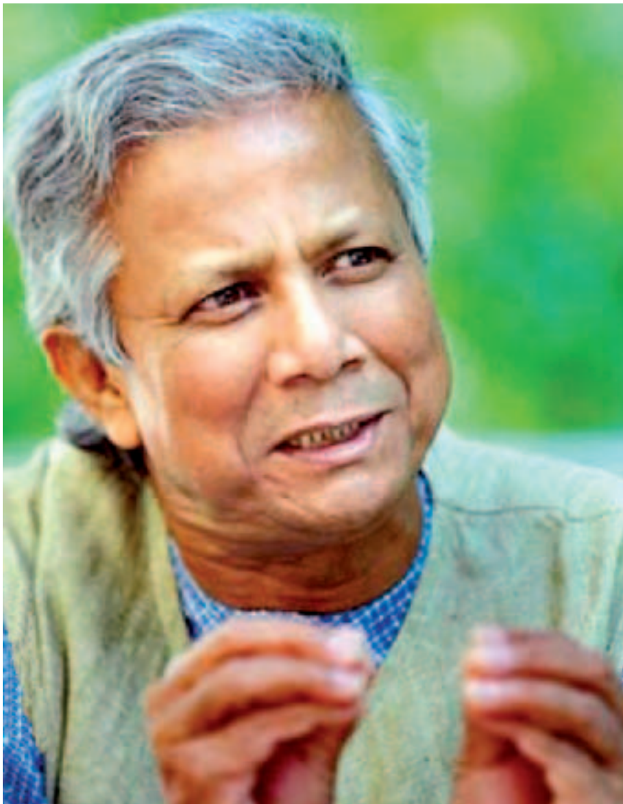
Muhammad Yunus: a capacidade de realizar

ta predominante no empréstimo a mulheres que se revelam como melhores gestoras e com melhor preparação para a organização dos pequenos negócios. O sucesso deste projecto enquanto factor de produção de riqueza em meios pobres foi servindo ao longo dos anos como inspiração para a criação de organizações similares, não só no terceiro mundo, mas um pouco por todo o planeta, estando este modelo implementado, actualmente em 23 países, com consequências práticas em milhões de cidadãos.