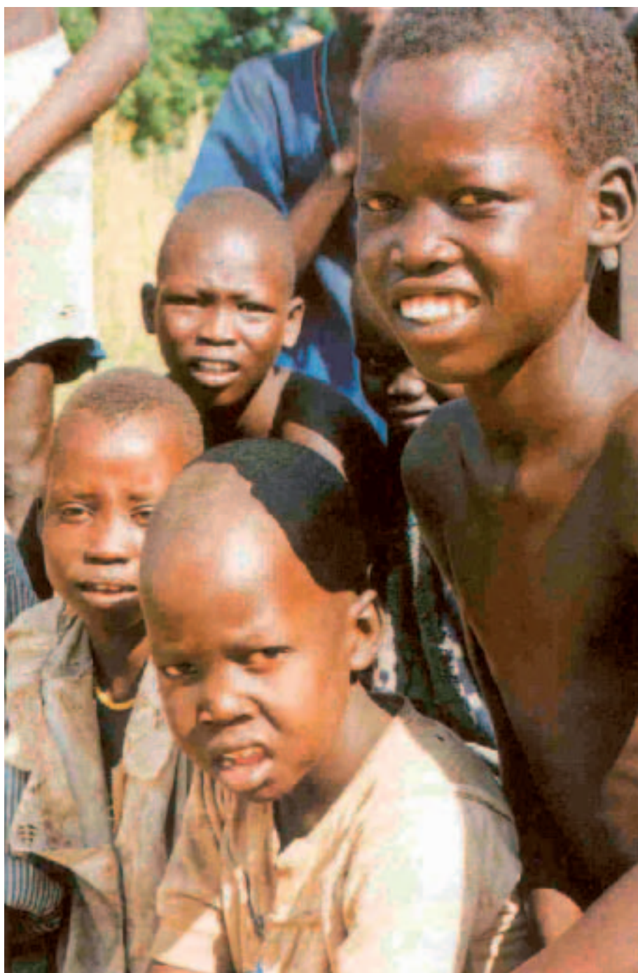
De entre os refugiados, os que mais sofrem são as crianças

um oceano de pobreza e desespero", disse ele. "Mais cedo ou mais tarde estes muros não vão aguentar. As pessoas vão ter de encontrar um modo de ficar."