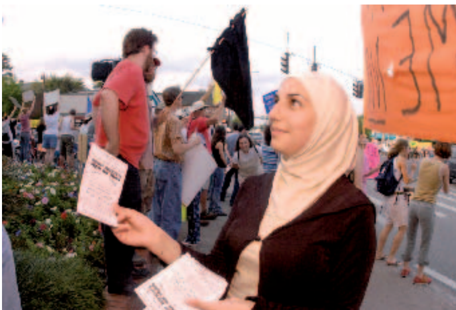
A integração dos muçulmanos depende muito do respeito pelos direitos da mulher

O último encontro do CEF decorreu em Istambul, entre os dias 3 e 9 de Julho, e foi dedicado, precisamente, à participação dos muçulmanos na vida política europeia. Neste contexto, é importante compreender as palavras do clérigo, pois elas devem ser entendidas como um sinal orientador do que poderá vir a passar a ser uma estratégia política/eleitoral dos seguidores de Maomé residentes na Europa. Uma das questões colocadas é, precisamente, a de saber como devem os muçulmanos guiar-se em períodos eleitorais. Que partidos escolher e que critérios utilizar? "Primeiro, o programa. É próximo dos valores islâmicos?" - diz Youssouf Al-Qaradawi. É importante ter em conta, acrescenta, "não apenas a moral islâmica, mas também a justiça social, a ajuda aos mais desfavorecidos, o meio ambiente, a defesa de causas justas, como a palestiniana e,