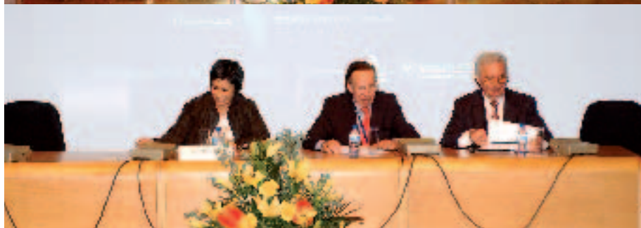
As mesas das sessões sobre Segurança Social, Fundos de Pensões e Seguros e de encerramento