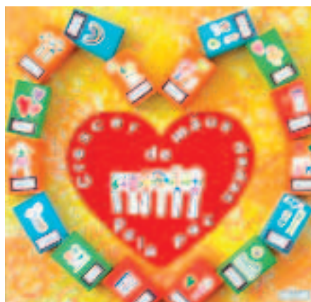
Um dos trabalhos feitos pelas crianças

aprovação desta lei, foi assinado um protocolo entre o Observatório permanente sobre a produção, comércio e proliferação de armas ligeiras e o Ministério da Administração Interna que vem de encontro aos esforços daquele grupo de trabalho da CNJP, ficando expressa a sua cooperação, nomeadamente no que respeita ao desenvolvimento de acções específicas de esclarecimento e sensibilização junto dos mais jovens.