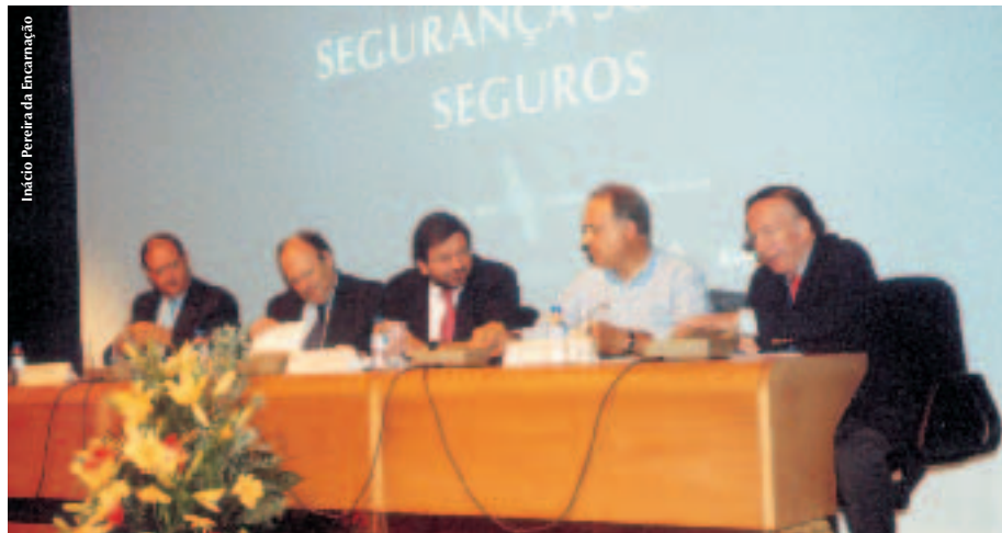
A mesa redonda: "Soluções a adoptar?"