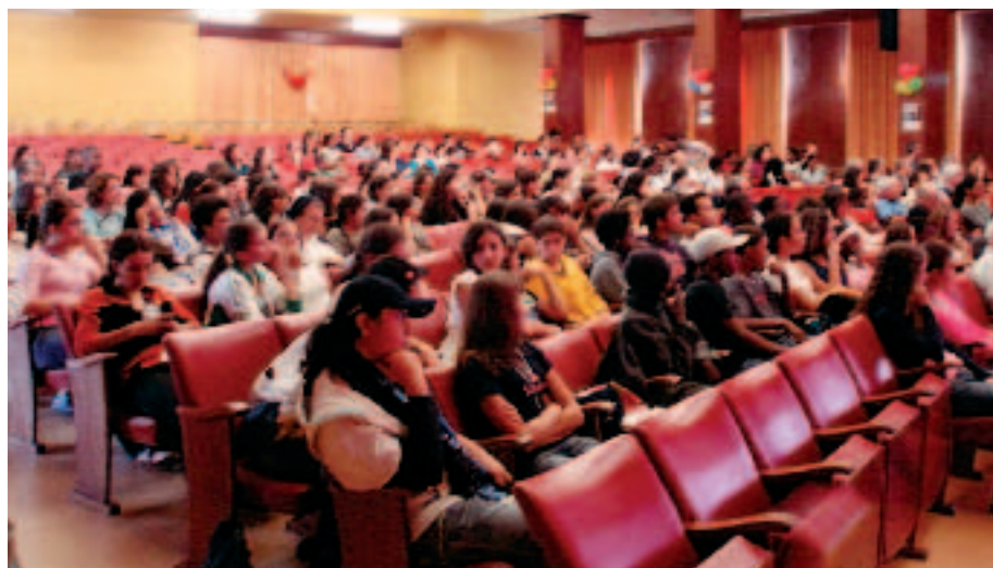
Crianças e jovens animaram o auditório do colégio de Santa Doroteia

Na sequência do debate público que desencadeou na sociedade portuguesa sobre a produção, comércio e proliferação de armas ligeiras, a Comissão Nacional Justiça e Paz (CNJP) levou a efeito, no dia 28 de Outubro, uma festa, destinada a crianças e jovens, visando sensibilizar as camadas mais jovens para aquele problema. A mensagem de que é possível viver numa sociedade mais segura e sem armas foi passada aos que estiveram presentes no Colégio de Santa Doroteia e, mais importante do que isso, foi levada para casa e para os meios de comunicação social possibilitando uma sensibilização mais vasta e comprometida.