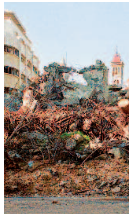
Beirute, antes e depois da guerra