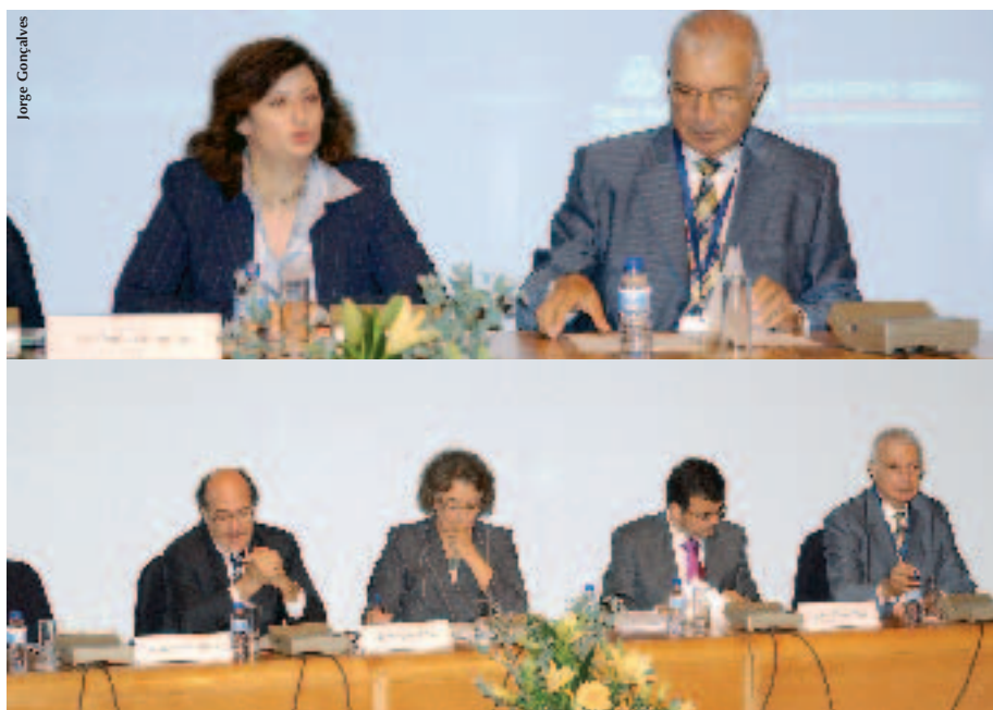
As sessões de abertura e sobre o Mutualismo

Assinalando os dez anos de existência do Forum Abel Varzim, decorreu no dia 14 de Outubro, na Culturgest, em Lisboa, o Colóquio "Mutualismo, Segurança Social, Seguros" marcado pela seriedade dos especialistas que nele participaram, pelo carácter sereno do debate e pela dinâmica da participação dos cerca de oitenta inscritos. Uma reflexão que valeu a pena e que deixou pistas concretas para encarar o futuro nestas áreas.